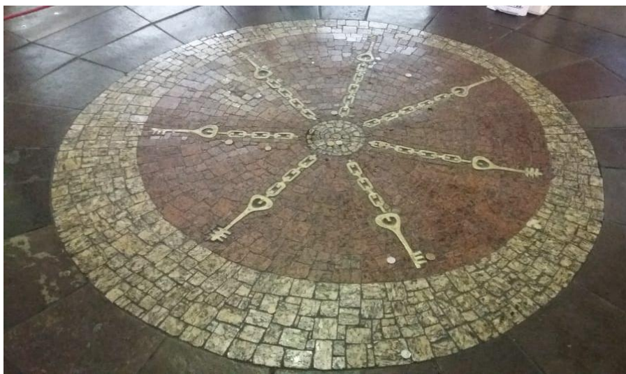
O mosaico demarcatório do Bará do Mercado é considerado o terceiro marco do Museu do Percurso do Negro