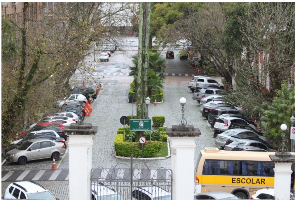
Local onde era o Pelourinho de Porto Alegre, atualmente é uma praça em frente à Igreja Nossa Senhora das Dores

Vejamos algumas fotos da visita a Porto Alegre: