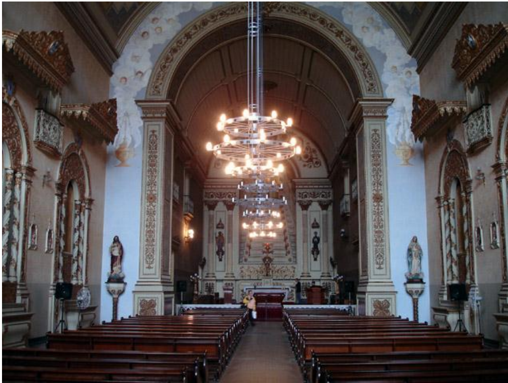
Interior da Igreja Nossa Senhora das Dores