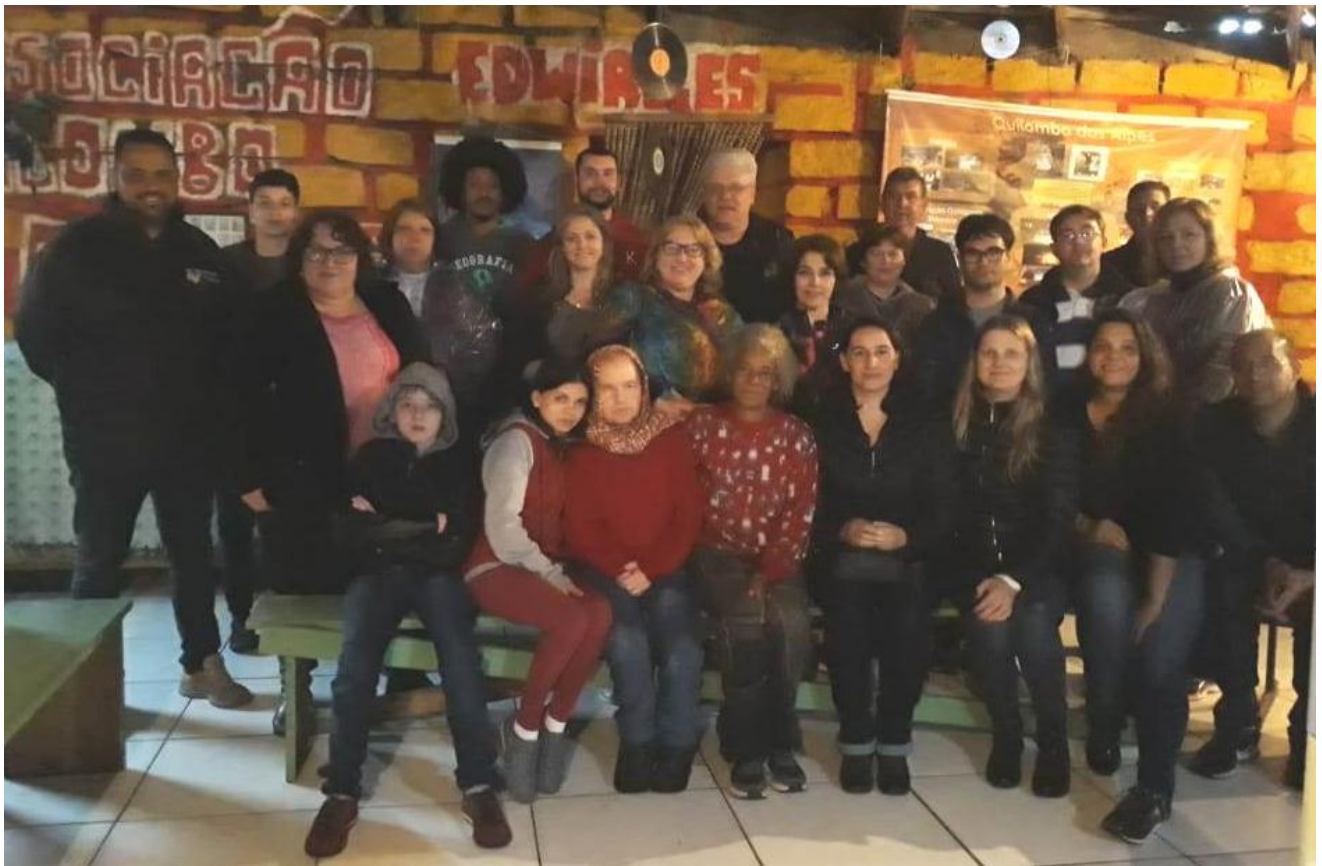
Integrantes da Equipe Multidisciplinar juntamente com alguns membros da Associação Quilombo dos Alpes