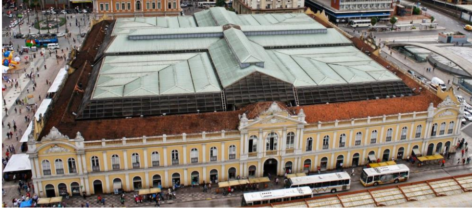
O Mercado Público Central de Porto Alegre é um prédio histórico da cidade