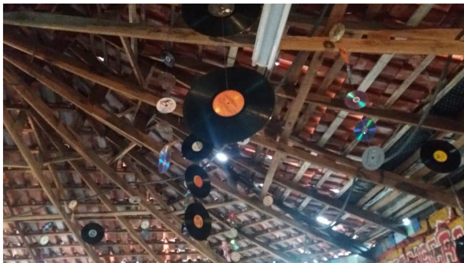
Imagens da parte interna da Associação Quilombo dos Alpes