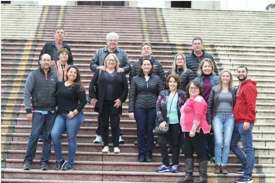
Integrantes da Equipe Multidisciplinar diante da escadaria da Igreja Nossa Senhora das Dores, a mais antiga igreja de Porto Alegre que se caracteriza pelas duas torres e pelos 65 degraus que a ligam à Rua da Praia