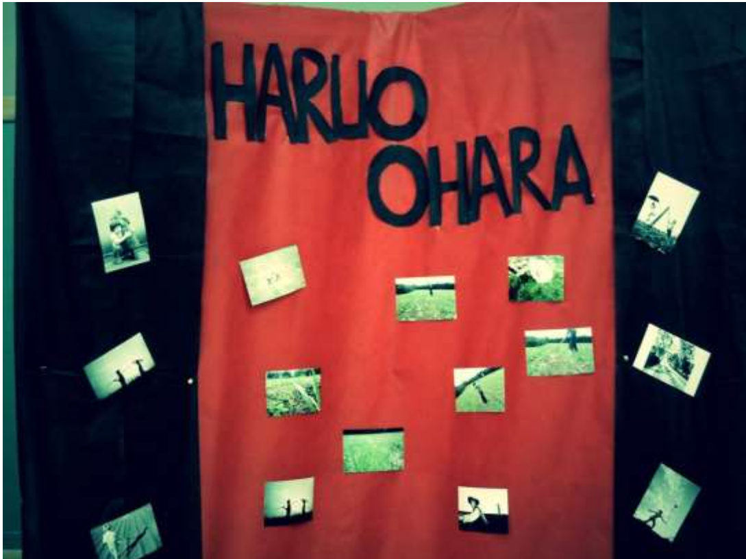
Fotografias dos alunos: apropriações de Haruo Ohara

HARUO OHARA - fotógrafo paranaense do início do século XIX, usando de muita criatividade, com os recursos da época, fotografa a família e a agricultura aproveitando a luz do dia, sob diferentes aspectos.