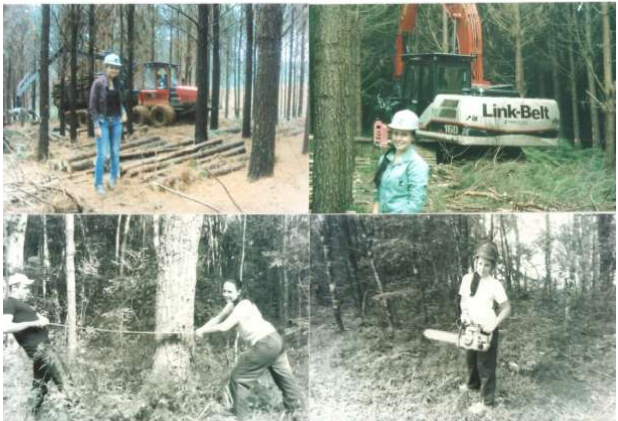
Algumas fotografias com apropriações da obra de Sebastião Salgado: a evolução do trabalho florestal