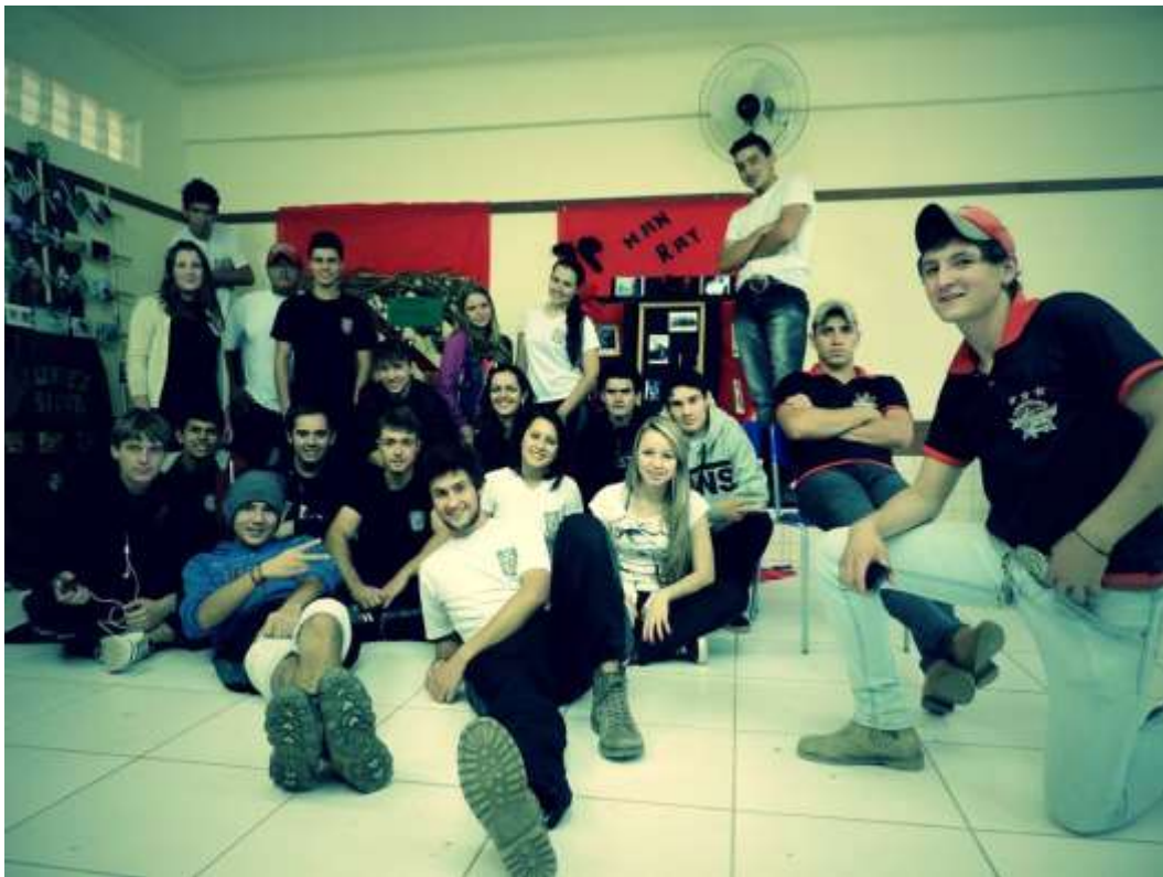
Alunos que organizaram a exposição de fotografias