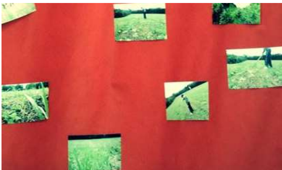
Detalhe da foto acima retratando a agricultura