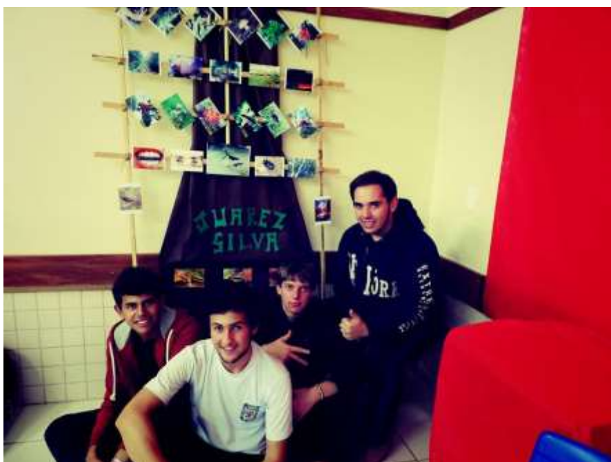
O expositor foi organizado pelos próprios alunos