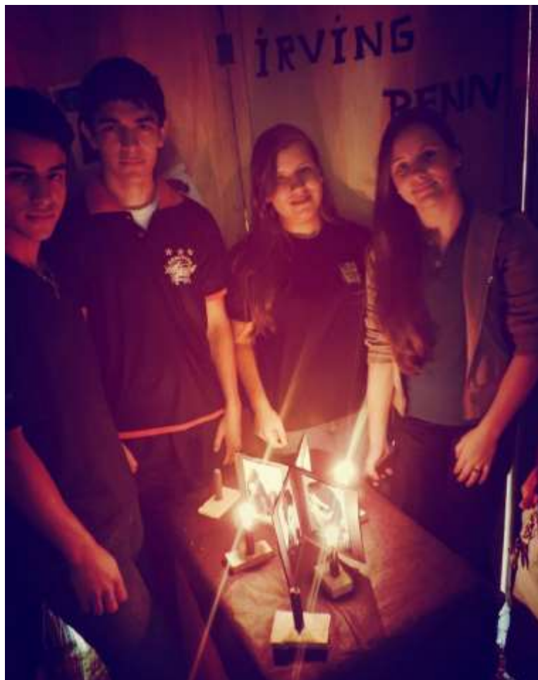
Foto dos alunos com apropriações de Irving Penn

IRVING PENN - fotógrafo da moda e de famosos, inova esse campo a partir da década de 40. Penn revolucionou um sem-número de gêneros fotográficos; no entanto, o campo da fotografia de moda é um daqueles em que sua marca foi impressa de forma mais profunda. É difícil imaginar o que seria da foto de moda contemporânea sem a seminal influência da estética de Penn – criador de uma beleza elegante e simples, mas construída com um rígido formalismo e uma sensibilidade incomum.