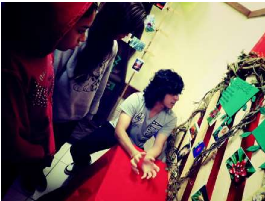
Alunos contemplando a exposição de fotos baseada em Juez Silva

JUAREZ SILVA - esse fotógrafo trabalha com a macrofotografia, de pequenos seres e objetos ou detalhes que normalmente passam despercebidos no nosso dia-a-dia, quais são fotografados em seu tamanho natural ou levemente aumentados através de aproximação da câmera ou fazendo uso de acessórios destinados a este tipo de fotografia.