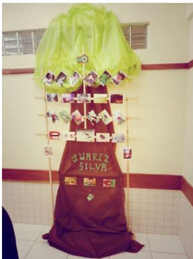
Foto do expositor completo montado pelos alunos para expor os trabalhos baseados em Juarez Silva