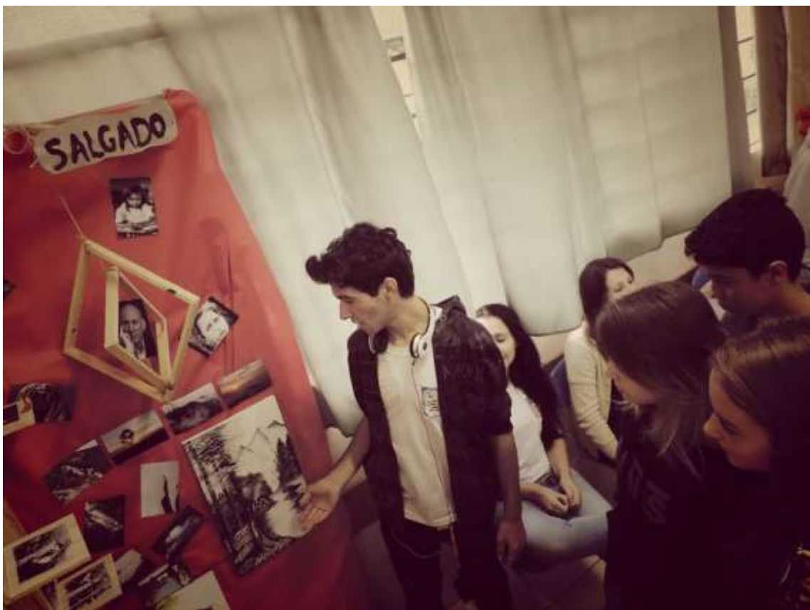
Foto da exposição baseada nos trabalhos de Sebastião Salgado, qual mescla fotos do artista e da turma

Confira algumas fotos da exposição referente ao Sebastião Salgado: