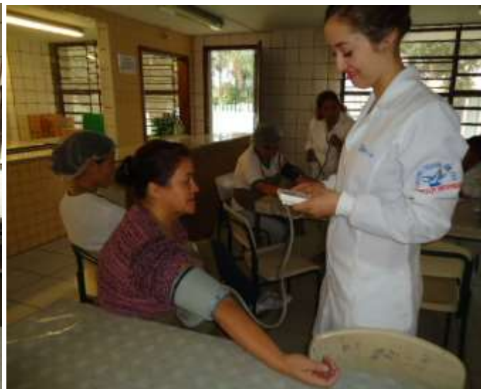
A aferição da Pressão Arterial também foi realizada com as “tias da cozinha”