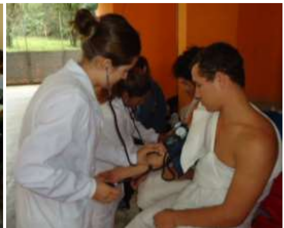
Para os alunos a aferição da P.A. foi algo diferente do cotidiano escolar